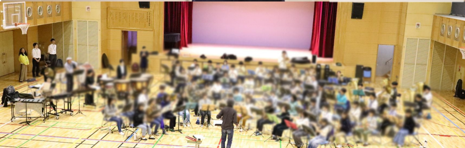
言葉が浸透していく 成長が音に表れる 杉並 YWO 最後の合奏練習 3 時間

杉並ユースウィンドオーケストラ 音楽監督・指揮 福田洋介先生 合奏練習時のコメントより