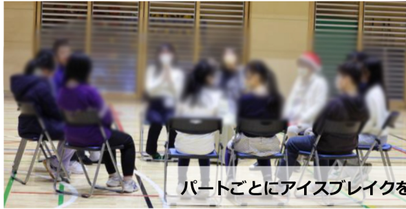
パートごとにアイスブレイクを取り入れながらスタート