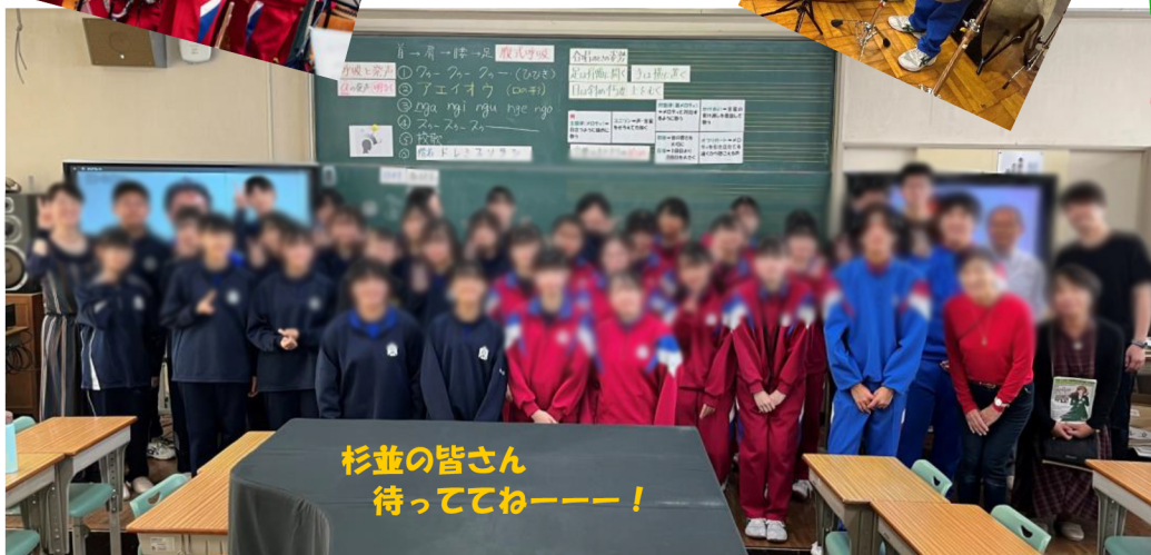
杉並の皆さん 待っててねー！！

演奏曲「遠つ人-雁金の宰-」では、曲を深く理解し表現するために、調べ学習を行ったそうです。そこで感じたことをイラストや文章にして部員で共有、難しい曲もイメージを持つことで、しっかり自分の曲にしている様子が伝わりました。