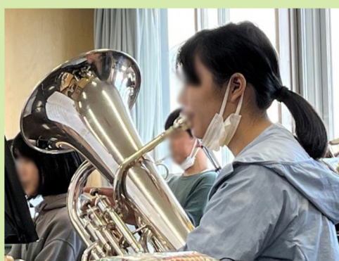
高円寺学園 5F 第 2 音楽室

13:30～14:45 木管楽器：パート練習 金管楽器：分奏 → 大アリーナに集合 → 15:00～16:30 合奏