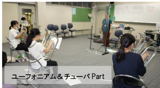
ユーフォニアム&チューバ Part