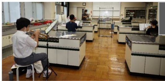
トランペット Part 2組に分かれて