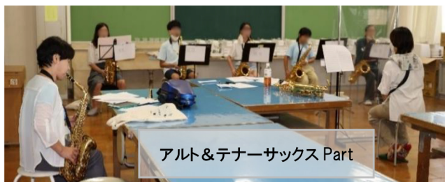
アルト&テナーサクソ Part